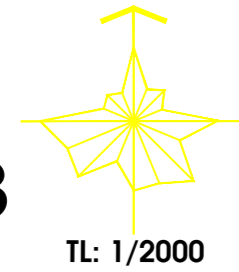
CHỨC NĂNG VÀ CÁC CHỈ TIÊU QUY HOẠCH KIẾN TRÚC KHU ĐẤT TRƯỚC KHI ĐIỀU CHỈNH (THEO QUYẾT ĐỊNH SỐ 323/QĐ-UBND NGÀY 08/9/2008 CỦA ỦY BAN NHÂN DÂN QUẬN 12)