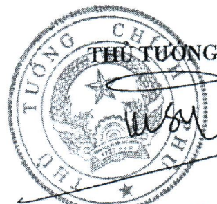
Phạm Minh Chính