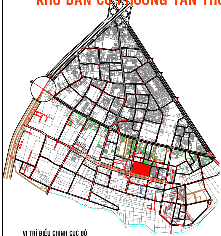
VỊ TRÍ ĐIỀU CHỈNH CỤC BỘ